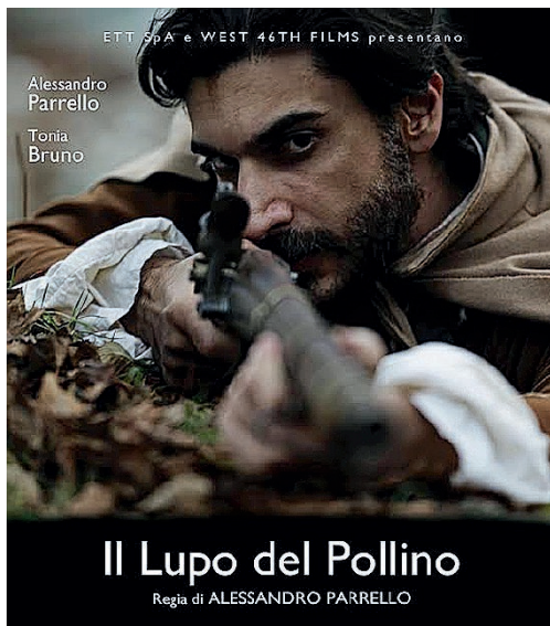
CIAC La locandina del cortometraggio